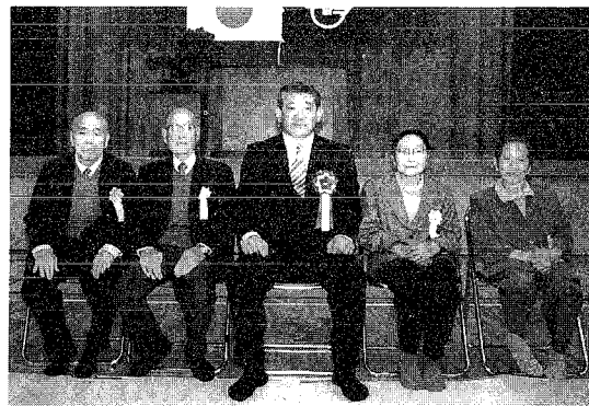
▲88歳、米寿のみなさん