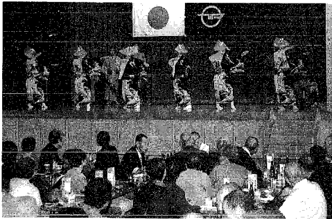
▲民謡研究会によるアトラクションで盛り上がりました