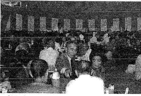
▲祝賀会でもみなさんお元気です