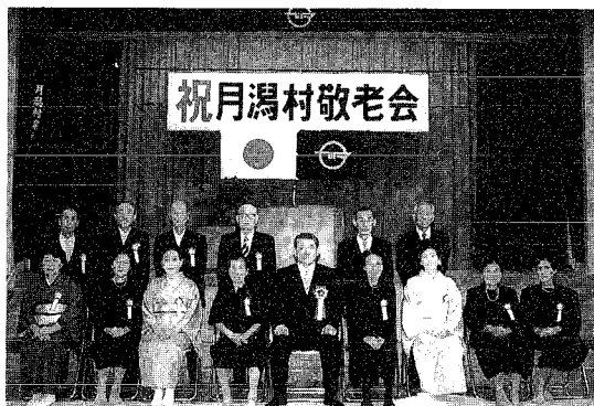
▲ダイヤモンド婚、金婚のみなさん