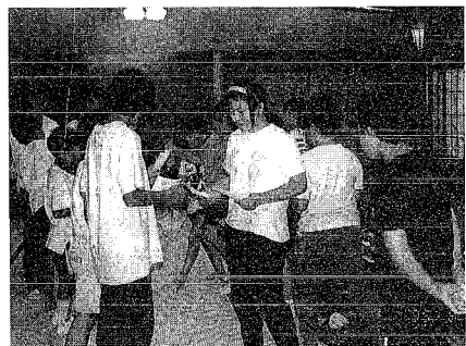
▲楽しい夕食交流会

みんな楽しそうに話が盛り上がり、予定していた時間より1時間余り延長し、有意義な歓迎夕食会となりました。翌日、早朝、村長や役場関係者の見送りを受けて月寿荘を出発し、午前中、北方文化博物館とマリニピア日本海（水族館）を見て、空路で北海道に帰りました。さっそく、月形町の児童から楽しく交流ができたと思い出をつづった「ありがとう」のお手紙がとどきました。