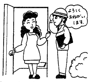
お宅の電気設備は大丈夫ですか?

当協会の調査職員がお宅へお伺いしたときや再訪問のお知らせをしたときは、どうか協力をお願いします。