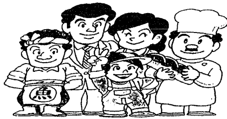
国民年金は将来の生活を支える大切な制度です。

平成7年4月1日から 老人保健医療などの 受給者の一部負担金が変わります 平成3年の老人保健法改正により創設された老人医療に係る一部負担金の物価スライド制により、 老人医療 (70歳以上の人が及び65歳以上70歳未満で、一定の障害を持っている人) 県老医療 (65歳以上70歳未満で1人暮らしなどの人) 県障医療 (65歳未満で重度の心身障害のある人) 県乳医療 (出生日から満1歳になるまでの人) ひとり親家庭等の医療 それぞれを受給する人は、平成7年4月1日から医療費の一部負担金が外来の場合1,010円(現行1,000円)に変わり、入院については現行一日700円が据え置き やさしい思いやりにささえられて75が愛の献血ありがとう ―― 2月17日実施 ―― 2月17日、北日本月濁食品(株)を会場に行われ、200ml25人、400ml50人、計75人の方からご協力をいただきました。ありがとうございます。 成分献血とは 血液中の血漿や血小板だけを献血していただき、赤血球などの成分を体内にお返しする献血方法で、体にいちばんやさしい献血といわれています。 今回の献血は4月21日(金)ご協力をお願いします。 ※詳しくは住民課保健福祉係までお問い合わせください。