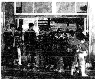
▶小学校においても早朝から募金活動が行われました。

直接送金される場合は、 兵庫県南部地震義援金 と明記の上 郵便振替 口座番号 00170-6-1020 名 義 日本赤十字社 (手数料は無料です)