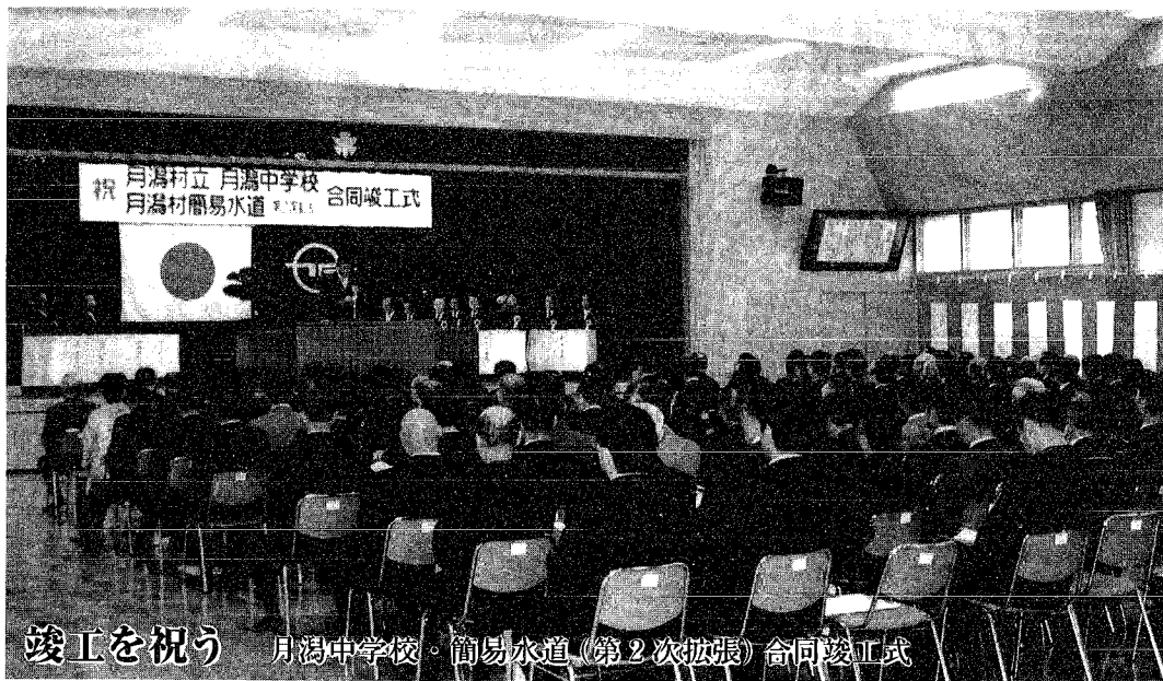
竣工を祝う 月潟中学校・簡易水道(第2次拡張)合同竣工式

今年も雪の季節を迎え、村では冬期間における道路確保ということで、毎年除雪計画を立てています。近年の暖冬のせいか、私たちの生活も雪に対する備えがいくぶんおろそかになってきているようです。しかし、冬の天候は変わりやすく、いったん寒波が入ると一晩で多くの雪を降らせてます。冬の道路網確保のため、除雪作業にご協力をお願いします。