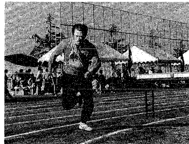
▲飴の味はいかがですか？