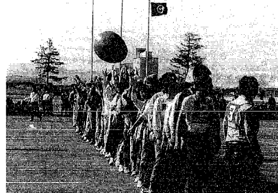
▲だるまさんはなかなか言うことをききません