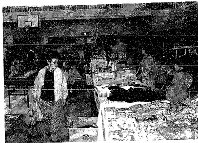
▲大勢の人でにぎわう掘り出し市

会場では、農産物の展示や即売、もちつき、綿アメ、松茸ごはん、とん汁をはじめ、姉妹町村である北海道月形町の紹介や、ルレクチェワインの試飲、掘り出し市、福引き、特産品の紹介、正面玄関での鎌組合による刃物研ぎなど、あいにくの天候にもかかわらず大勢の人