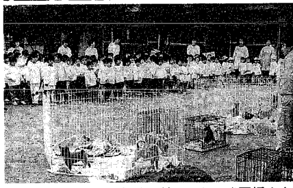
▲かわいい小犬、小猫を前にはしゃぐ園児たち

最初に巻保所及び動物愛護協会の方々から、動物の習性や飼い方などを色々教えていただき、次に、犬の訓練にうつりました。犬は、一歳前後のシェパード犬とラベラドール犬。体長は一・五メートルくらいもある大きな犬で、園児もびつくりしながら訓練を見つめていました。