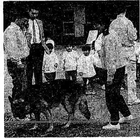
▶訓練のシェパード犬

その後、犬といっしょに記念撮影をし、生後一、二ヶ月くらいの子犬、子猫とのふれあいにうつりました。子犬を抱く子や、檻の中にいっしょに入る子など、さまざま形で動物とふれあいました。今回の体験をとおして、動物を愛護する心、生命の尊さなど、優しい気持ちを持った、心豊かな人間に育ってほしいと思います。