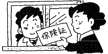
月に1回は必ず窓口へ提示しましょう

保険証切り替え後お医者さんにかかるときは、必ず保険証を窓口へ提示し、確認を受けてください。 また、月一回は必ず保険証を窓口へ提示しましょう。