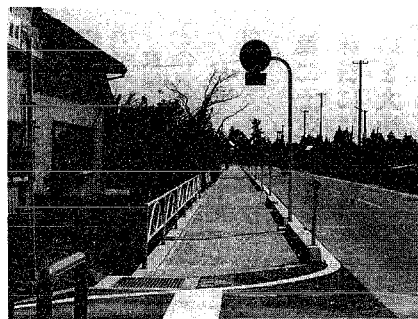
◀ 整備された歩道 (大別当地内)