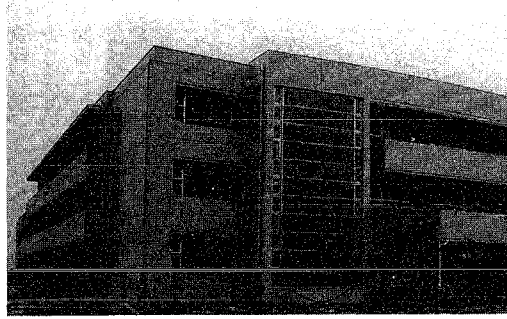
▶ 工事の進む学校建築