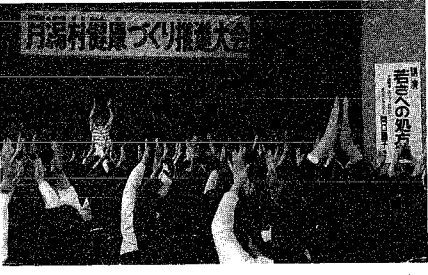
▲大盛況に終わった第2回健康づくり推進大会

〒950新潟市新光町4番地1 新潟県総務部知事公室 広報広聴課 ●問い合わせ先 ☎285-5511 内線2116