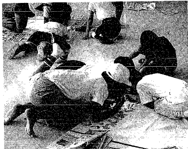
青少年教育計画から

○ 指導者の養成・増員。 ○ 一般の人から指導者を養成することが必要ではないか。 ○ 社会教育奉仕員を増やせばよい。