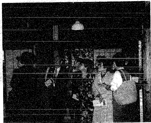
婦人教育計画から

提供できるように一層広報体制を整備していきたいと思えます。 社会教育調査のご報告も今回で終了させていただきます。調査にご協力いただいた村民の皆様にご心から感謝を申し上げます。