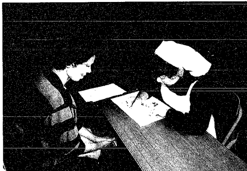
▲「日ごろの健康を相談」 「昔の料理はなつかしい」▼