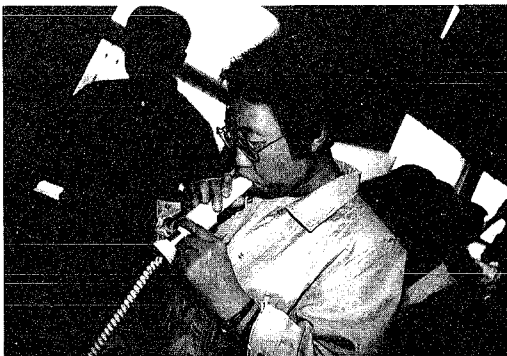
▲「フーっと、結構大変なんですな」