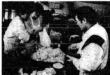
▲「これ面白い」「そうですよ」