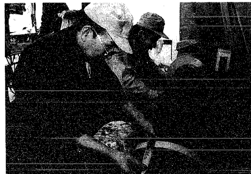
▼「包丁は大切に使ってください」

月潟村の産業や地域特産物の振興と発展を図る目的で、毎年恒例となった「産業まつり」が十月二十七日(日)に中学校体育館で行われました。