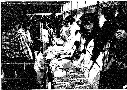
▲「このコーナーは手作りなんだって〜」

月潟村の産業や地域特産物の振興と発展を図る目的で、毎年恒例となった「産業まつり」が十月二十七日(日)に中学校体育館で行われました。会場となった中学校の体育館では、各種農産物の展示や即売、もちつき、綿アメをはじめ、米の消費拡大宣伝のために新米コシヒカリの抽選やコシヒカリご飯が来場者の人たちに配布されました。