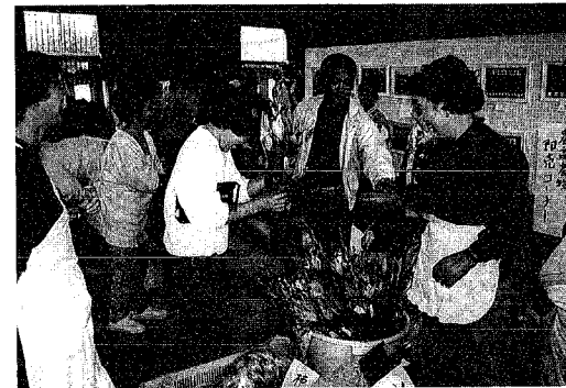
▲「これもあれもと花は大人気」

会場となった中学校の体育館では、各種農産物の展示や即売、もちつき、綿アメをはじめ、米の消費拡大宣伝のために新米コシヒカリの抽選やコシヒカリご飯が来場者の人たちに配布されました。