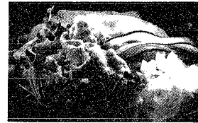
熱量1人分 146Kcal 調理時間 20分

豚肉はしゃぶしゃぶ用の薄切り肉で、新鮮なものを選びます。 牛しゃぶは、さっと火を通すくらいがおいしいのですが、豚肉の場合は、細菌の汚染の心配がありますから、必ず、十分に火を通してください。