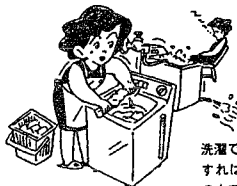
洗濯でも、工夫すれば一回100ℓの水ですむはずですが、流しっ放しスタイルだと240ℓになります。

バケツ洗いなら杯ですむ洗車も、流しっ放しのホース流いでは、30杯以上の水が必要です。