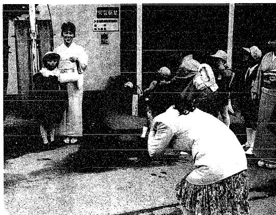
▲はい、ポーズの後にスナップ。 入学式にはつきものですね。