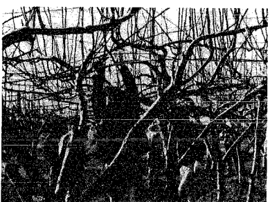
▲「ここをこうやって」