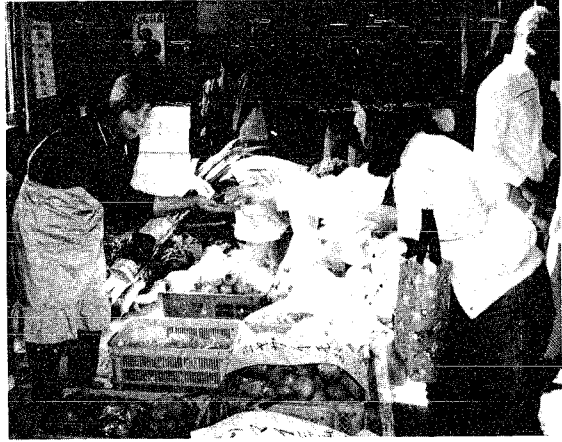
「いらっしゃ〜い」「これもうわ!」 ○野菜の即売コーナーのカット

当日は、良い秋晴れに恵まれ、健康展、小・中学校の文化祭などが重なり、大勢の人で賑わいを見せていました。