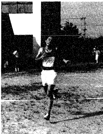
▶二連覇のかかったブルボンチーム ◀初の村長杯なるかの中学二年男子チーム