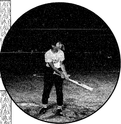
「ぼくは4番バッター」 だけど… ソフトボールは楽しいよ!!

青少年育成月潟村民会議の主催による親子ソフトボール大会が、八月二十四日村野球場でにぎやかに行われました。この大会は、親子の和と仲間づくりを通じ、明るい家庭づくりを立立てようと毎年開催しているものです。