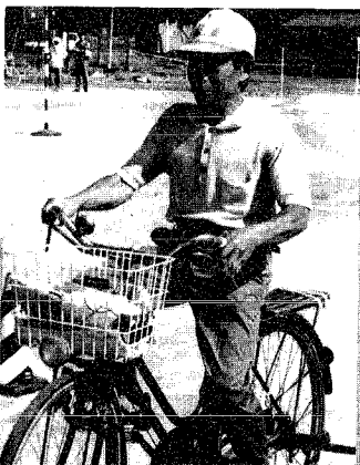
自転車は、しっかりした姿勢で、正しく乗るのがコツだよ！

八月三日は、料理教室がありました。その時は、何を作るのかなとか、おばあちゃんがいるけどどうしようかなあと、思いました。最初は、モザイクゼリーのつゆを作り、次にリングハンバーグを作って、最後には、大豆サラダを作って出来上がりでした。その中で、一番かんたんだったのは、やっぱり大豆サラダでした。食べる時、おいしいかなと思って食べました。すごくおいしかったです。八月七日、大豆サラダを作ってみました。みんなよここんで食べてくれました。よかったです。