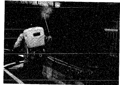
このように、一生懸命に行われますご協力をお願いします

や、果実に被害をもたらすもので、薬剤防除だけでは、防ぐことが出来ません。「植えない・買わない・持ち込まない」よう特段のご協力をお願いします。