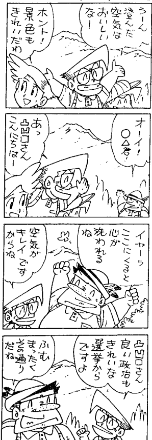
(今月から代わります)