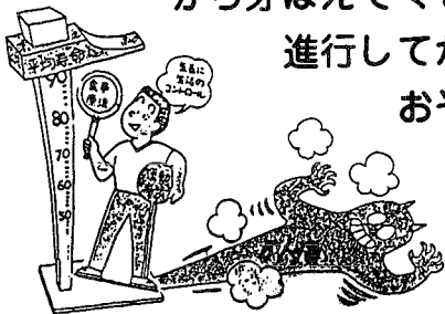
高齢化とともにふえる成人病