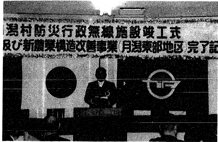
▲防災行政無線関係者、新農構事業関係者ら総勢120名の参加で行われた式典

※これらの措置は政令で定めた特別の事情のある者、並びに老人保健法の規定による医療及び、公費負担医療を受けることのできる者については適用されません。