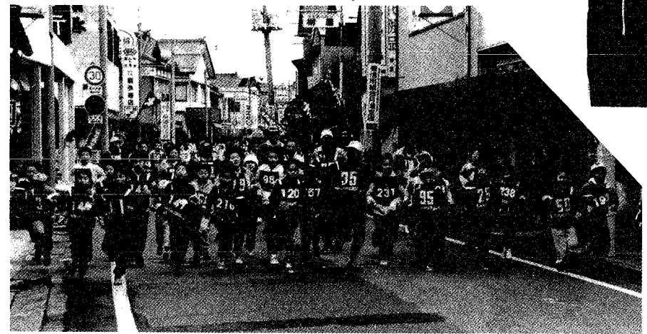
声援を受け、市街地を力走する参加者