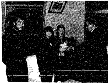
村長に募金を手渡す小学生の代表

昨年十月から年末まで実施いたしました共同募金は、皆様方の暖かいご協力により、月潟村の目標額を上回ることででき終りました。募金運動にご協力いただいた各地区の役員（総代）の方始め関係各位に、心から感謝申し上げます。募金の集計がまとまりましたのでご報告いたします。