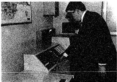
▲12月26日行われた「防災行 政無線開局式」の様子