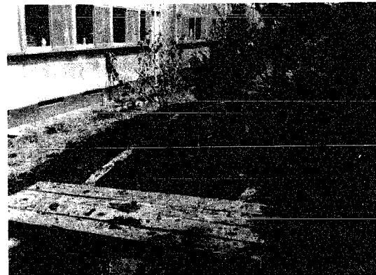
きれいに改修された池

すっかりお年寄り(?)に定着したゲートボール。若さと健康を保ち老人クラブ会員の親睦を図ろうと八月から毎週水曜日の早朝、連合会主催により定期的に西萱場ゲートボール場で開催されています。この日集まった参加者は約三十人、二面のコートを使い「カチン」「カチン」と快い音を響かせ真剣な顔でボールを追っていました。皆さん健康的で楽しそう、これから始めたい方、参加しませんか。