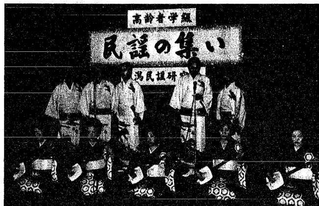
▲パチさばきも軽快に、歌と三味線を披露

祭り期間中は、白根警察署備話所、月潟祭連絡本部を月潟集落開発センター、TEL(七五)一四二五二番に設置いたします。