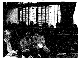
▲歌や踊りにお年寄りも満喫顔

6月2日月寿荘において民謡の集いが開催され、月潟民謡研究会皆様の素人芸とは思えない歌や踊りに、拍手を送っていました。