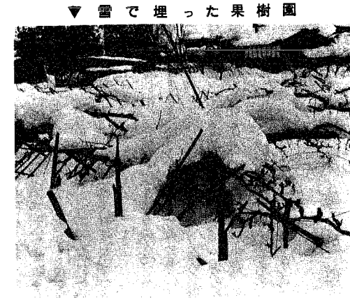
▼ 雪で埋った果樹園