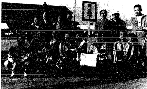
▲優勝カップ独占?の月潟下チームの面々

月潟村民総参加による、第十六回村民運動会が去る、十月十四日月潟中学校グラウンドで開催されました。当日は肌寒い一日でしたが、新調された七つの優勝カップを目指し、熱戦を展開、ジャンボ縄飛びは、息が合わず、悪戦苦闘、また、チーム混合の大玉送りや、つな引きに声援も集中し、熱気に包まれたなかにも楽しい一日となりました。