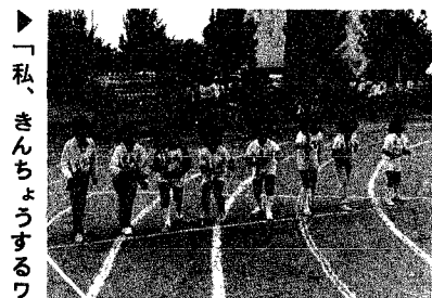
▶「私、きんちようするワ」