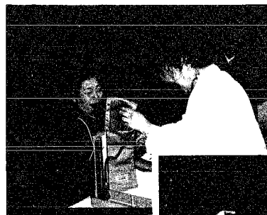
▶歯科衛生士による はみがき指導