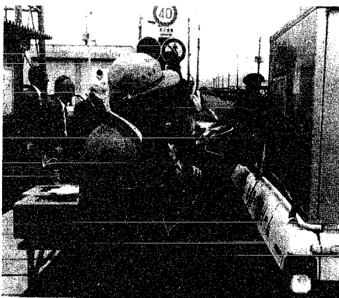
ナシを配って、事故ナシを 呼びかける母の会々員

交通事故ゼロ二千日を目指す、秋の全国交通安全運動中の去る九月二十六日、交通安全協会、交通安全母の会、月潟農協の人達が、役場前に設置された交通指導所で、出勤途中のドライバーに名産の二十世紀ナシを配り安全運転を呼びかけました。 シートベルトとヘルメット着用、パンフレットを入れて用意した約百五十袋は、一時間足らずになくなりました。 また、同時にシートベルト着用も呼びかけましたが、着用者は少ない状況でした。 中には着け方の分からない人もあり指導を受けていま