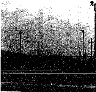
テニスコート施設の建設