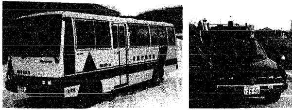
積載車・バスの購入