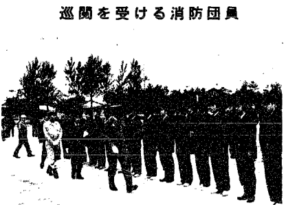
巡閲を受ける消防団員