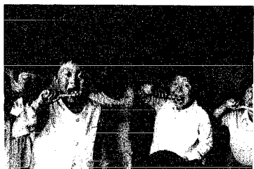
歯みがきしてまへす

こまめな手入れで寿命を延ばそう 人間の平均寿命は年々延びています。ところが歯の寿命のほうが一番長い。歯はだいたい60年、短い下あごの奥歯は40年と人間の寿命より短くなっています。手入れ次第で歯の寿命は延ばせます。手入れの第一は「歯を清潔に保つ」こと、食後は歯みがきや「ブクブクうがい」で食べカスを取り除いておくことが大切です。