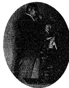
司会者の二人の 息もぴったり!