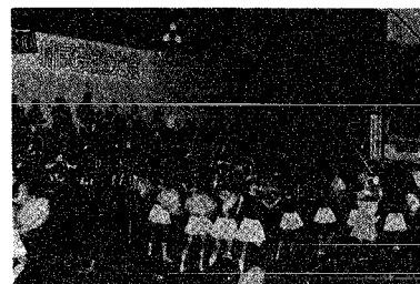
小学校トランペット隊による演奏