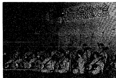
見事な三味線の合奏

村民の間に定着しつつある村民芸能大会が去る十一月二十一日月潟小学校体育館を会場に開催されました。今回は小・中学校を含め十五団体の参加で大盛況でした。 この芸能大会は公民館、学校と運動実行委員会主催で、村民とのふれあいの場として、又、各団体の発表の場として皆さんに親しまれています。 今後も皆様の御理解と御協力により一層充実させて行きたいと思っております。