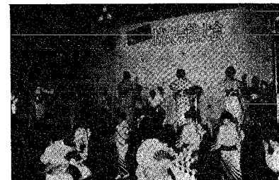
オープニング……出場者全員による月潟音頭