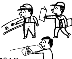
10月1日 就業構造基本調査

なお、調査員は知事により任命されており、調査票に記入していただいた内容ははかに漏すことは絶対にありません。また、調査票は、統計を作るためだけに利用されますから、個人や世帯の秘密は完全に守られます。調査票にはありのまま記入してください。