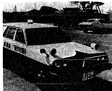
サンスカイライン (一六〇〇cc) 交通事故撲滅のため、今まで以上に威力を発揮することでしょう。

五十二年六月より、交通安全運動のシンボルとして活躍してきた交通指導車が、この度、新しい車とパトランプチシました。(ニッ