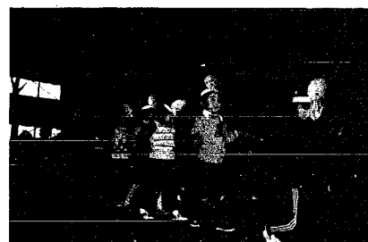
＝演技をする元気な子供たち＝

交通事故、詐欺、横領その他の犯罪の被害者で、検察官の不起訴処分（犯人を裁判にかけない不起訴）に不服の方は、檢察審査會に審査の申立てができます。檢察審査會は、國民の代表として、衆議院議員の選挙権を有する者の中から委員の選舉權を有する者の中から「くじ」で選ばれた檢察審査員で構成され、審査の申し立てを受け付る事件と事件の真相を調査し、犯人が不起訴されるべきものと判断したと起訴されるべきものと判斷したことが検事正のその旨を勧告することのできる國の機關です。詳しいことは左記へおたずね下さい。 新潟市学校通の新一新潟地方裁判所内 新潟檢察審査會事務局 電話〇二五二一(2)一四三三