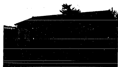
大別当集落開発センター

集落開発センターは、木造瓦葺平屋建一室、 7\text{m}^2 （三八・五坪）和室十畳二室、八畳一室に調理室を備えた近代的な集會場であります。部落では、センターの完成を祝して十一月二十五日新潟農政事務所長、白根農業改良普及所長等多数の来賓出席を得て、盛大に竣工式が挙行されました。 工事費 九三四二千円 県補助金 四〇〇〇千円 部落負担 二三四二千円 村費 三〇〇〇千円