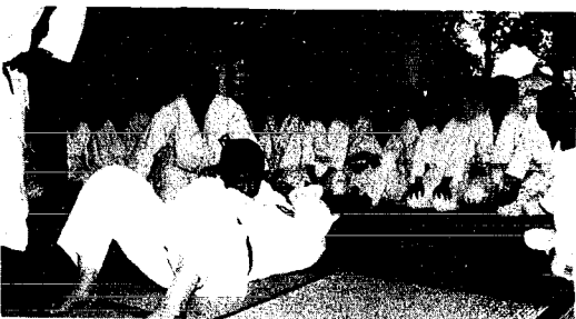
汗を流さなくちや

第一日目、午前六時三十分には月湯を出発、九時三十分には瀬波に到着しました。あいにくの雨で予定していたスケジューリングが大幅に変更となり、午前中は柔道の練習午後からは晴れ間をみて散歩、夕食後は村上市のライブラリーよりフィルムを借りて映写会、となんとか日程を組み直し、二日目の暗