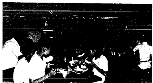
合宿の一コマ 楽しい時間

七月二十八日二十九日の両日、瀬波温泉のお寺でスポーツ少年団の合宿が行なわれました。この合宿は身心の鍛練と共同生活のなかで連帯性を養い責任感をもたせることを目的として毎年行っているものです。