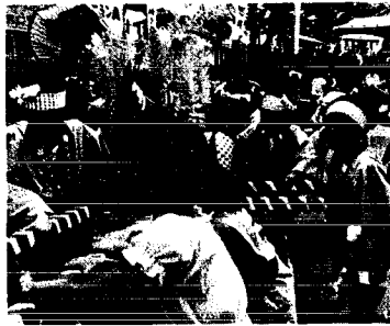
上...子どもタルミコシで祭も本格的 下...角兵衛獅子でにぎわった白山神社