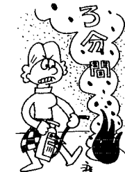
消火は始めの3分間 通報は早く!!