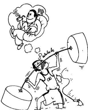
心の定着と安定は、日々の労働と引渡後の安定と見守る。

時々刻々、剣が峰に立たされていく小規模事業主の皆さん、自分の身体と能力を磨き、使っておられる自 しかし、一方で今現在を破壊する要因もまた何と多いことでしょうか。ちょっと考え ◎加入できる人 ▽常時使用する従業員数が二十人以下 (商業、サービス業は五人以下) の個人事業主及び会社 企業組合、協同組合の役員。 ◎掛金は ▽一口五百円、最高三万円の範囲内自由 (最低千円で五百円まで) に加入ができます。 ◎共済金の支払いは ▽個人事業主が事業をやめたとき ▽会社、企業組合、協同組合の役員が、その法人の解散により役員をやめたとき ▽会社、企業組合、協同組合の役員が疾病、負傷又は死亡により役員をやめたとき、