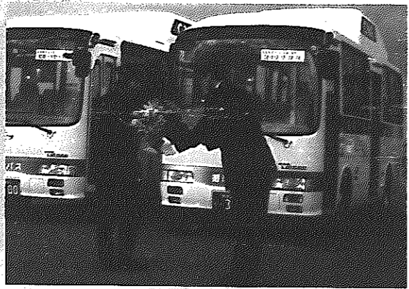
循環バス試行運行スタート

7月13、14日にかけて発生した水害は、県内の広い範囲で猛威を振りました。白根市は幸い人的被害はなかったものの、河川の増水により、信濃川堤外地の農作物に甚大な被害を受けました。また約1050世帯に避難勧告を出すなど警戒態勢が敷かれました。この災害で、市の被害総額は約5億円にも及びました。