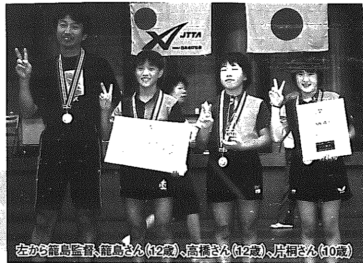
左から籠島監督、籠島さん(12歳)、高橋さん(12歳)、片桐さん(10歳)