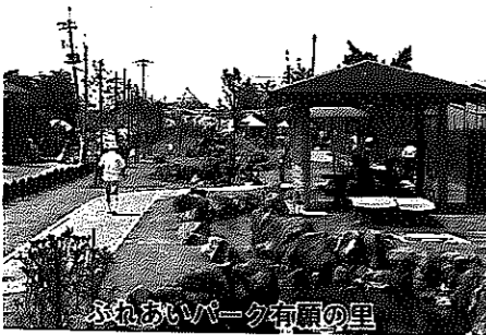
ふねおいパーク有願の里