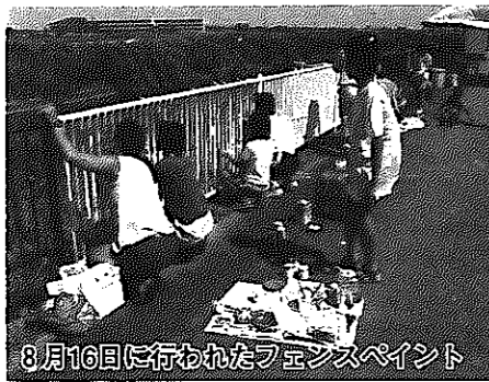
8月16日に行われたフェンスペイント