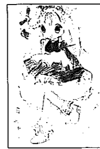
アノコトノハフマンさん(11歳 中笠巻6)