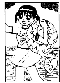
アラブ★Cさん(14歳 白井)