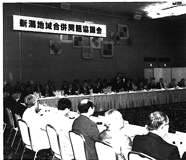
新潟地域合併問題協議会(任意合併協議会)が発足