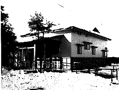
白南中学校体育館棟建設工事開始