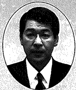
白根市長 吉沢真澄