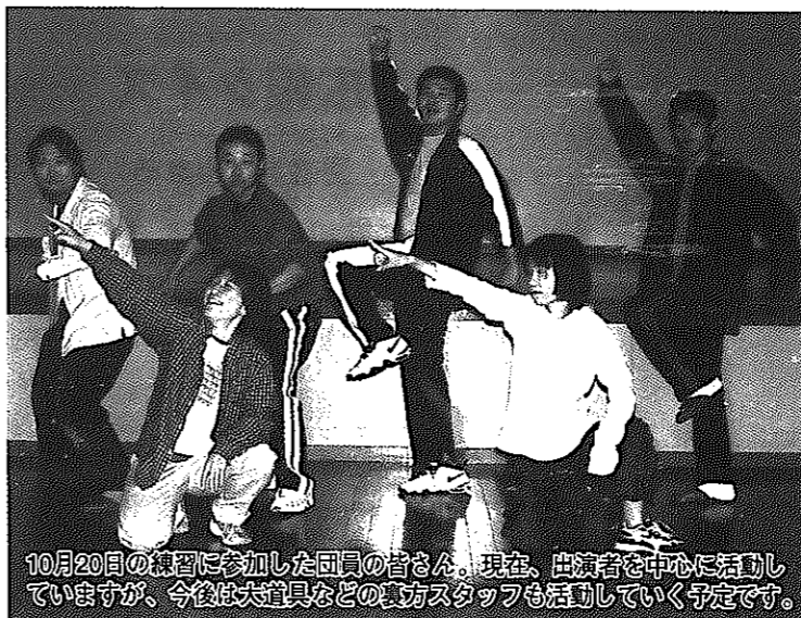
10月20日の練習に参加した団員の皆さん。現在、出演者を中心に活動していますが、今後は大道具などの裏方スタッフも活動していく予定です。